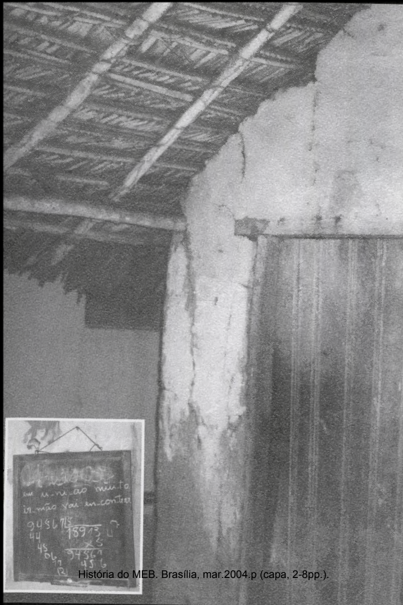
História do MEB. Brasília, mar.2004.p (capa, 2-8pp.).