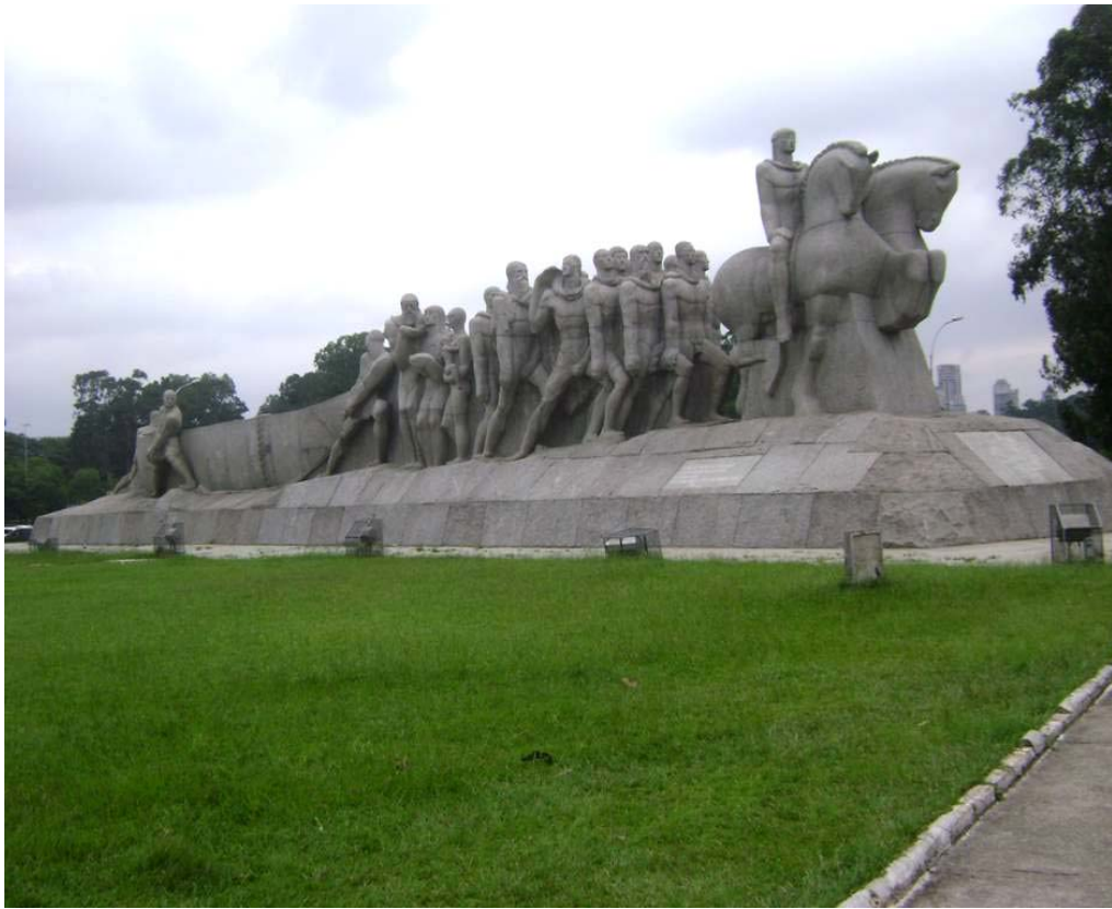
Imagem 2. Monumento às Bandeiras. Parque do Ibirapuera-São Paulo