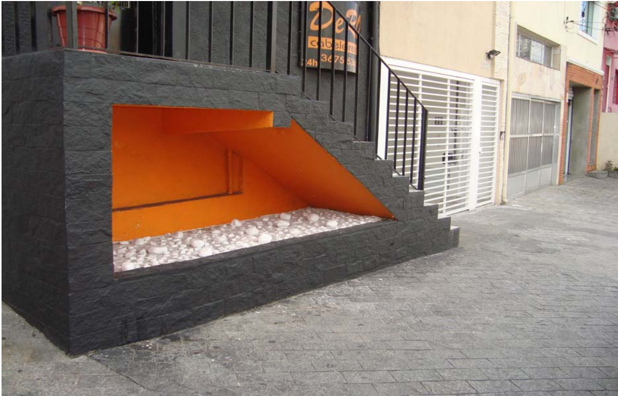
Imagem 10. Essa escada de um estabelecimento comercial sintetiza com muita propriedade a reordenação dos espaços da cidade visando dificultar ou afastar definitivamente os moradores de rua de determinados locais. Na imagem, datada do dia 12 de abril de 2010, vê-se uma escada existente na rua Dr. Franco da Rocha, entre as ruas João Ramalho e Bartira, e, embaixo desta, um espaço repleto de pedras. Esse local era, antes da reordenação, um ponto de dormir dos moradores de rua; agora não é mais.

Até o início do ano de 2009 havia na calçada da rua Cardoso de Almeida uma moradia que ocupava quase que todo o espaço do passeio público (calçada) num percurso de 4 metros. O morador era um senhor de aproximadamente 50 anos. Devido a construção de um conjunto de lojas, algumas residências antigas da área, e também parcialmente sem locatários ou moradores, foram demolidas. A moradia sobre o espaço da calçada fez parte do projeto: deixou de existir, assim como tantas outras construções, independente da arquitetura que tenham. 6 Esse processo demonstra muito bem o aparecer de algumas territorializações e memórias e o deixar de existir de outras.