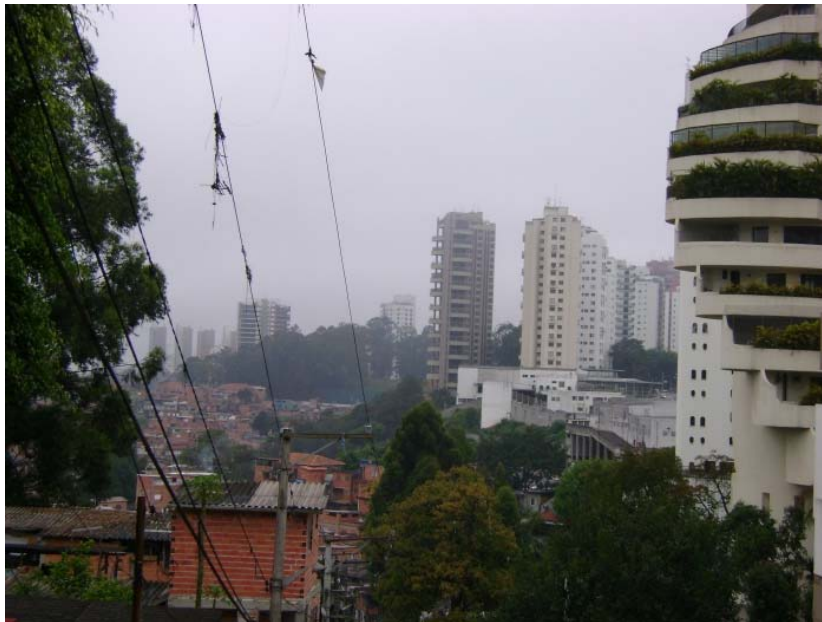
Imagem 3. A mesma paisagem, porém vista de outro ângulo. O contraste entre padrões de vida fica ainda mais evidente. Pobreza e riqueza convivem praticamente juntas. (FARIAS, 2009b). A comunidade ocupa uma área de 800.000 mil m 2 , que corresponde a 97 campos de futebol, e tem 80 mil habitantes. De acordo com levantamento realizado pela Prefeitura no decorrer dos anos de 2006 a 2008, cerca de 80% dos moradores não possuíam rede de esgoto, 60% estavam sem energia elétrica e 21% eram semi-analfabetos (FARIAS, 2009a).

Além disso, a modernização que vigora na América Latina busca desqualificar com muita rapidez as pessoas pobres ou não detentoras de uma educação institucionalizada. Raramente são tornadas públicas afirmações como esta: