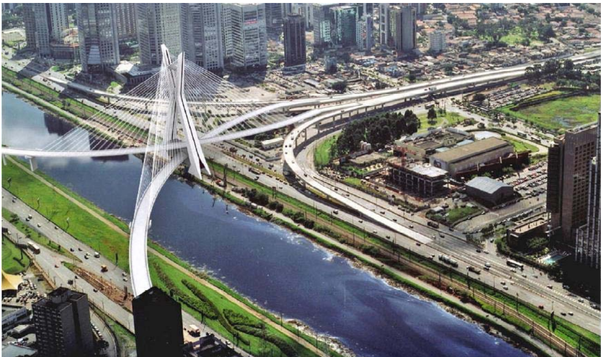
Imagem 1. Ponte Estaiada Octavio Frias de Oliveira, inaugurada no dia 10 de maio de 2008, na zona sul da cidade de São Paulo (SP). O “progresso”, a modernização, da obra de 138 metros de altura que pode ser vista de vários pontos da cidade contrasta com moradias miseráveis (favela na avenida Jornalista Roberto Marinho) e moradores de rua que são sistematicamente afastados da obra-cartão postal de São Paulo. Há policiamento em pontos estratégicos da ponte e isso evita a fixação de moradores de rua embaixo da obra. (FOI..., 2009).

No Brasil, a modernização é bem mais presente do que a modernidade. Os grupos dominantes ou as elites dirigentes se encarregaram de estruturar a sociedade ao seu modo. Quando a população mais humilde tentou fazer parte das discussões, a força foi, quase sempre, a resposta da elite para os “contestadores”. Obras públicas, licitações, cargos e inclusive aprovação ou alteração de leis são práticas já comuns desde longa data neste País e visam atender sobretudo os anseios e interesses das elites dirigentes.