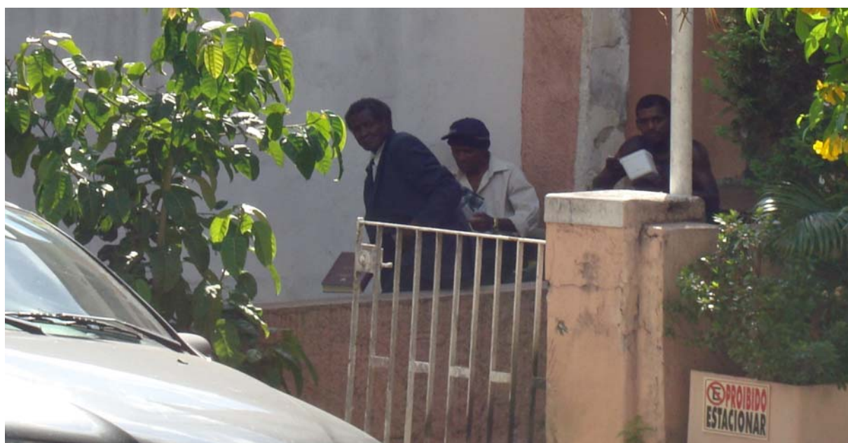
Imagem 4. Moradores de rua no Bairro de Perdizes, na zona oeste da cidade de São Paulo (SP). No momento em questão, por volta das 15 horas do dia 19 de novembro de 2009, os sujeitos faziam a refeição do almoço, quase sempre com alimentos doados pelos proprietários de restaurantes existentes nas ruas Bartira, Monte Alegre, João Ramalho ou Cardoso de Almeida. 3

A cidade passou a ser cada vez mais um local de práticas múltiplas que, por vezes, conflitam-se cotidianamente. A modernização cidadina conseguiu em alguns casos afastar os populares ou pobres de algumas áreas centrais e privilegiadas em infra-estruturas das cidades, porém não eliminou na totalidade os cotidianos considerados “indesejáveis”. De acordo com a FIPE, no ano de 2000 havia 8.706 moradores de rua (adultos e crianças) na cidade de São Paulo; em 2010 já eram 13.666. Houve, portanto, um aumento de 57% em uma década (DRAMA NAS RUAS, 2010, p. 2).