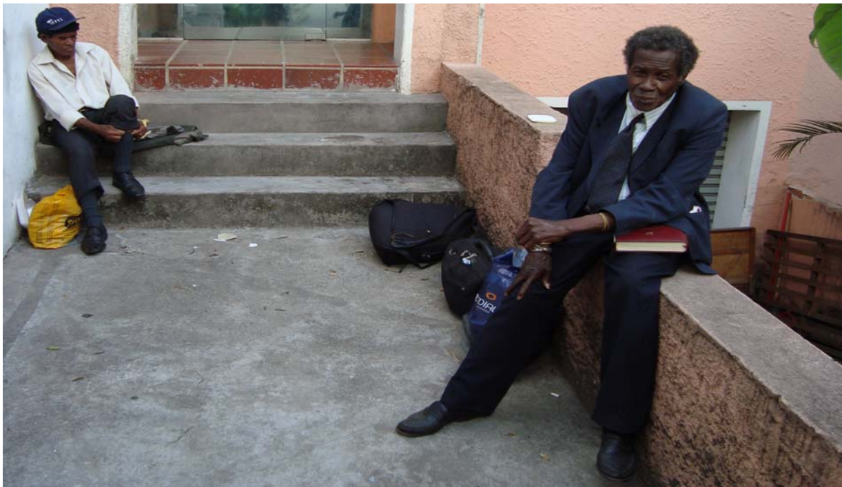
Imagem 5. O senhor que aparece no lado direito da imagem, de terno azul escuro, tem 70 anos, sendo que vive na rua há mais de 4 décadas. Conforme relato feito por este sujeito no dia 19/11/2009, as adversidades existentes na rua são de várias ordens. Para viver na rua é preciso ter conhecimento específico dos territórios da cidade e das pessoas que podem fornecer alimentos, roupas e medicamentos. É preciso saber que alguns horários possibilitam determinadas práticas e outros não; pedir alimentos nos restaurantes é um exemplo; utilizar locais para dormir é outro.

Esta materialidade não fica restrita ao mundo concreto. Modificar a concretude também pode alterar o cotidiano das pessoas. Numa megalópole como São Paulo, que possui em torno de 11 milhões de habitantes, há múltiplos cotidianos em ação. O espaço citadino acolhe experiências etárias, geracionais, partidárias, de gênero, culturais, dentre inúmeras outras formas de constituição do que se pode chamar de “identidade” ou “identidades”.