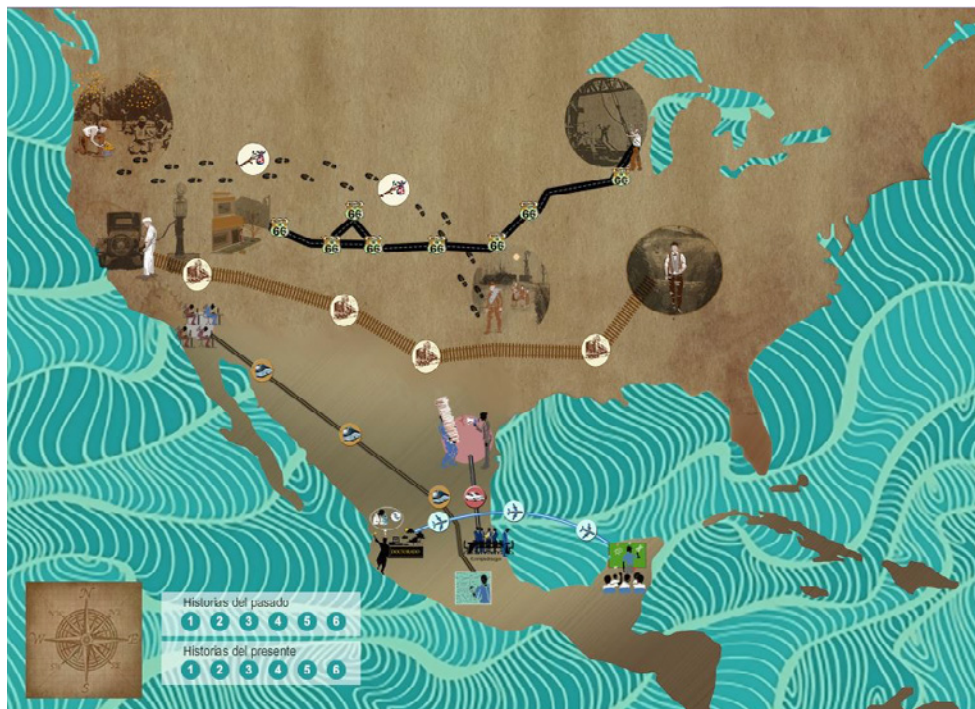
Figura 1: Una captura de pantalla del mapa digital que se realizó para este proyecto.

El mapa elaborado en este trabajo crea una sensación anacrónica, donde la historia de O'Malley dialoga con la de los estudiantes de posgrado mexicanos. Este aspecto se rescata en el diseño de la cartografía. Como se puede apreciar en la figura 1, el mapa usa dos texturas diferentes. En Estados Unidos se utiliza un color arenoso que hace referencia al fenómeno del dust bowl 6 de la primera mitad del siglo en Estados Unidos, mientras que en México se usa un color metálico, referente a las maquiladoras del siglo XXI que se encuentran al norte de ese país. De igual manera, la textura del mar representa la falta de arraigo y dificultades de los participantes dentro las historias.