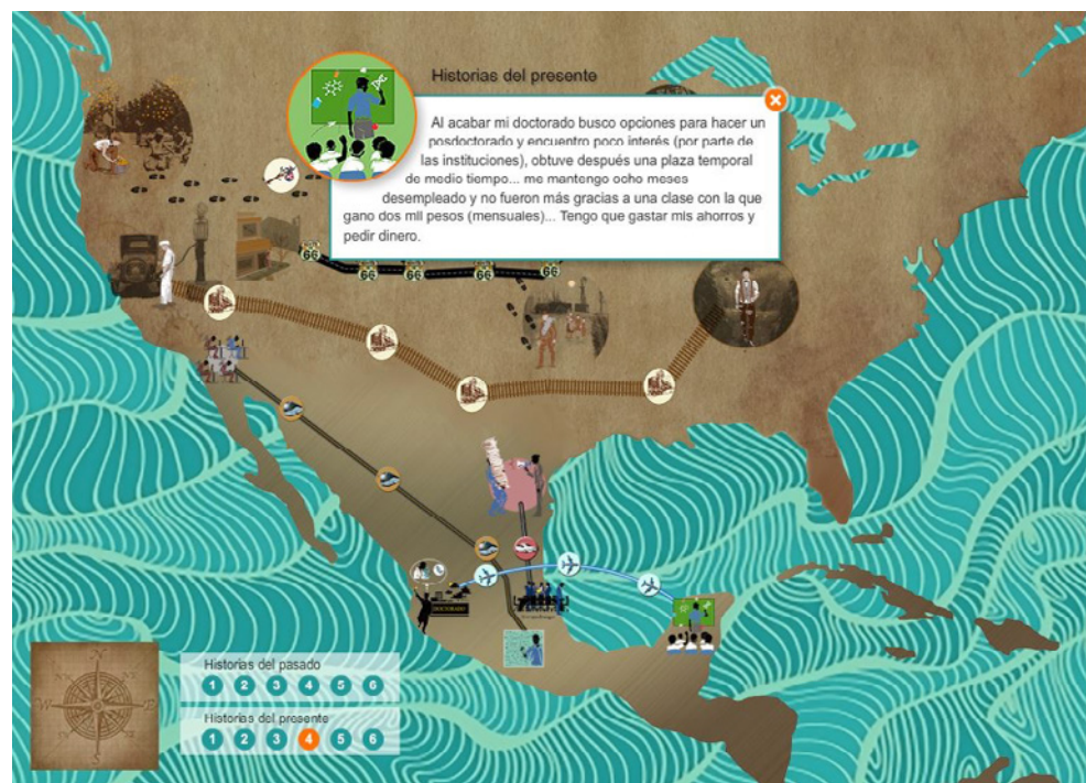
Figura 3: Fragmento de la historia de vida de uno de los informantes en el mapa.

[...] más tarde George me llamó y me dijo, -Escucha no tengo que decirte que las cosas están difíciles. Frunció su cara como si hubiera tragado algo amargo y continuó, -Ese chico va a hacer tu trabajo por la mitad de tu salario Yo me quedé frío, él prosiguió -Sabe de mecánica, lo interrogué y me contestó... Ponte en mi lugar, tengo un chico que va a hacer tu trabajo por la mitad del dinero y aparte sabe de mecánica. -No tenía sentido protestar y le pregunté, - ¿Al menos puedo terminar el día? -Negó con la cabeza, -Lo siento chico, ya sabes cómo es esto. (O'MALLEY, 2003, p. 116)