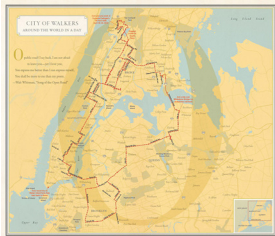
Figura 5. City of Walkers .