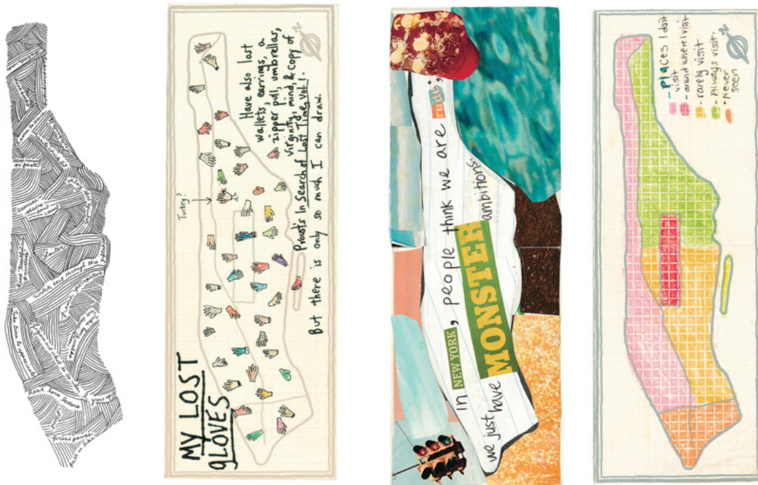
Figura 4. Alguns mapas do livro Mapping Manhattan , de Becky Cooper. Fonte: The New York Times . Disponível em: goo.gl/LJsGco . Acesso em: 25 abr. 2017.

de seus moradores. Ainda que essas pessoas compartilhem um mesmo espaço geográfico, as narrativas individuais desse atlas demonstram que a cidade se multiplica em uma infinidade de lugares. Dessa maneira, a autora se propõe a tornar visíveis as cidades invisíveis (COOPER, 2013) 2 .