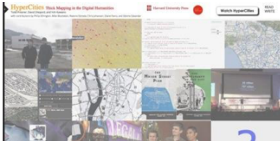
Figura 1. Tela inicial do projeto HyperCities .

Harlem (ROBERTSON et al., 2015), uma pesquisa colaborativa promovida pelo Departamento de História da Universidade de Sydney, que procurou mapear o cotidiano do bairro do Harlem, em Nova Iorque, entre os anos 1915 e 1930. Um projeto de mapas e geografias sobre o holocausto (KNOWLES et al., 2011) foi desenvolvido para o United States Holocaust Memorial Museum, revelando um extenso material baseado em textos, fotos, vídeos e animações, além dos próprios mapas. Já o projeto HyperCities (PRESNER; SHEPARD; KAWANO, 2014) propõe uma plataforma colaborativa que agrega pesquisas na área de humanas sobre mapeamento de lugares no mundo. Essas pesquisas incluem desde relatos de evacuação durante o acidente nuclear em Fukushima no Japão, a história de judeus de Los Angeles, o mapeamento de tweets durante a primavera árabe ou estudos urbanísticos em Vancouver no Canadá. Outro projeto que também pode ser classificado como um mapeamento profundo é o Where you are (ARIDJIS et al., 2013). Esse projeto, composto de um site e uma publicação impressa, reuniu 16 artistas, escritores e pesquisadores para propor experiências e reflexões sobre os mapas. Cada autor criou uma espécie de narrativa cartográfica que expõe suas próprias opiniões e visões sobre o processo de mapeamento, podendo conter vídeos, desenhos e textos.